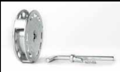
MBX® Adaptador: (incluido en el juego SDB-001)