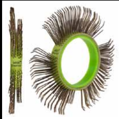
Cepillo MBX® Die Blaster®, 11mm, Derecho: