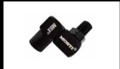
Conector Giratorio (incluido en el juego SDB-001)