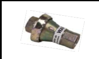
Regulador de presión de aire (incluido en el juego SDB-001)

Minimal pressure: 100 psi / 7.5 bar Maximal pressure: 170 psi / 18 bar