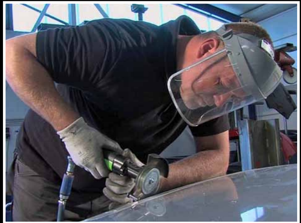
Juntas de techo