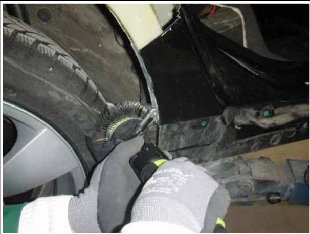
Cubre llantas / salpicaredas