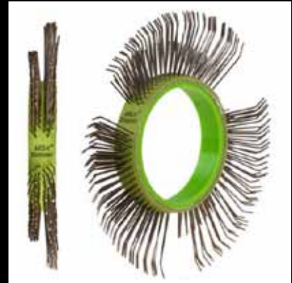
Cepillo MBX® Die Blaster®, 11mm, Izquierdo: