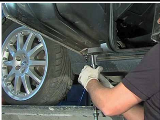
Ribetes de puertas