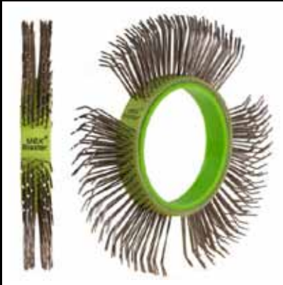
Cepillo MBX® Die Blaster®, de 11mm Completo