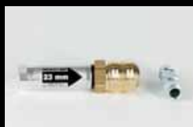
Regulador de presión de aire 23mm Art.No. ZU-071