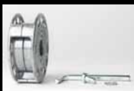
MBX® Adaptador de 23mm Art.No. AS-009