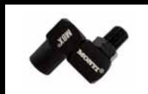
Conector giratorio para toma de aire Art.No. ZU-073