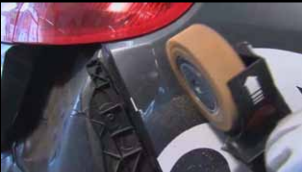
Remueve el vinil muy fácil

O vista nuestra página web: www.monti.de/flash/vinylzapper.html