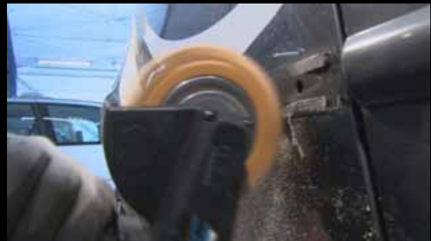
Remueve residuos de adhesivos