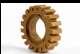
MBX® Vinyl Zapper Art.No. ZU-010-01